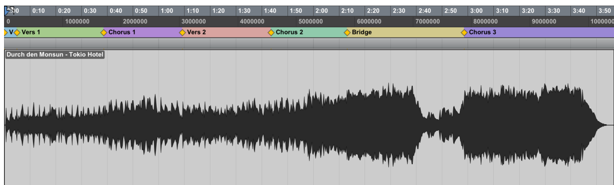
Abb. 2: Songaufbau „Durch den Monsun“ (Tokio Hotel)